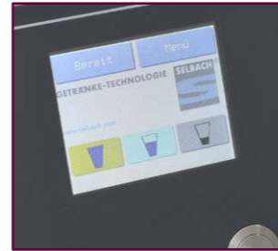
3 Getränke in 3 verschiedenen Portionen

Dürfen es 0,2 - 0,3 oder 0,4 Liter Glühwein sein? Oder ein Kakao mit immer gleicher Ausschankmenge? Bis zu drei Getränke in jeweils drei unterschiedlichen Portionen lassen sich mit dem HOTSHOT-Portionierer programmieren. Neben unterschiedlichen Getränkegrößen (klein, mittel, groß bzw. Kinderportionen o. ä.) lässt sich damit sicherstellen, dass genau so viel im Becher ankommt, wie gewünscht ist. Zusätzlich lassen sich sogar Zapfpausen programmieren.