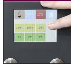
Über das Menü sind viele Einstellungen möglich

Bediener können beim HOTSHOT-Heißgetränke-Portionierer auf dem Touchscreen die Portionsgrößen einstellen und im Notfall den Zapfvorgang unterbrechen. Zusätzlich kann der Betreiber über einen codierten Zugang weitere Einstellungen vornehmen: Pumpen können ein- und ausgeschaltet, die Pumpengeschwindigkeit zwischen 30 und 100% geregelt sowie die Portionsgrößen eingestellt werden. Falls gewünscht, können Daten abgefragt werden – u. a. auch die Anzahl der gezapften Portionen.