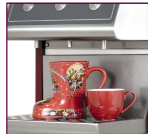
Höhenverstellbare Tropfschale: unterschiedlich große Gefäße können befüllt werden

Die Temperatur wird beim HOTSHOT-Portionierer mit einem Prozessor elektronisch gesteuert. Die Erwärmung der Getränke erfolgt gleichmäßig und schonend. Im „Stand by-Betrieb“ wird die Temperatur beibehalten; die Heizung schaltet sich bedarfsgerecht an und aus. Damit das Getränk bei optimalem Stromverbrauch jederzeit optimal temperiert ist.