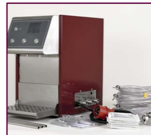
Im Paket: alles für den perfekten Anschluss

Die hohe Leistung schlägt sich darin nieder, dass der HOTSHOT-Portionierer innerhalb von ca. 5 Minuten betriebsbereit ist und bis zu 100 Liter pro Stunde problemlos heiß gezapft werden können. So wird es jedem Kunden warm um's Herz, während durchgehend in unterschiedlichen Portionen weitergezapft werden kann.